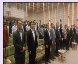
شرکت در رویداد فرصت های شغلی دانش بنیان کمیته امداد امام خمینی (ره)