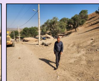
بازدید میدانی وضعیت اینترنت همراه روستای سرچشمه شهرستان سپیدان