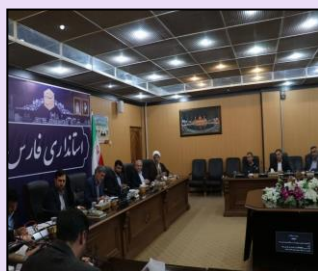
شرکت در جلسه شورای عالی اطلاع رسانی استان فارس به ریاست استاندار فارس