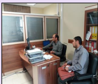
بررسی وضعیت ارتباطی روستای کوپان شهرستان سرچهان با حضور دهیار روستا