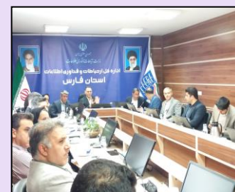
جلسه کارگروه دفاتر پیشخوان خدمات استان فارس با حضور نمایندگان شهرداری شیراز