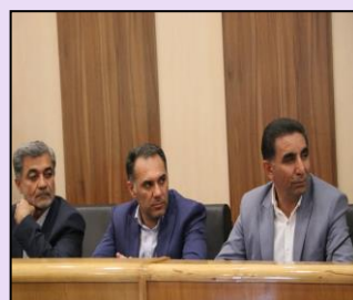
شرکت در جلسه شورای برنامه ریزی و توسعه استان